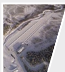
2017 Ivalo, Finlandia Hankook Technotrac