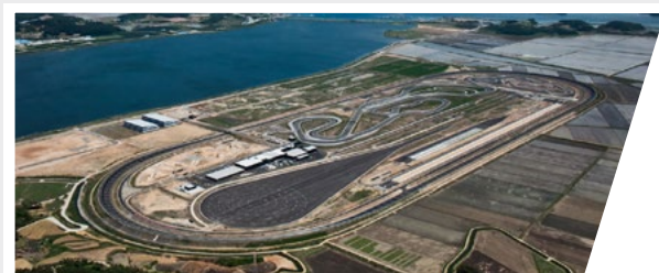
2022 Taean, Corea Hankook Technoring