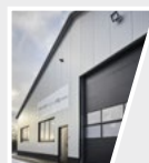
2021 Meuspath, Germania Nürburgring Workshop