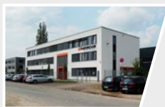
1997 Hannover, Germania Centro Tecnologico Europeo (ETC)