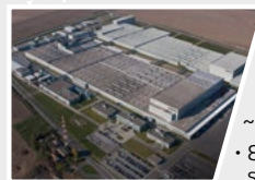
2007 Rácalmás, Ungheria Impianto europeo