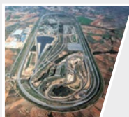
2006 Idiada, Spagna IDIADATrac Workshop